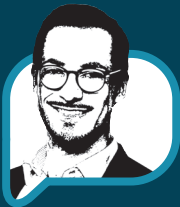
Von Holger Schmidbauer

Wir stehen regelmäßig vor der Herausforderung des Streckengeschäfts in die USA. Unser Kunde A in Kalifornien bestellt die Ware bei uns und wird unser Rechnungsempfänger (Bill-to). Die Lieferung soll jedoch direkt an seinen Endkunden (Kunde AB) in New Jersey erfolgen (Ship-to). Meine Frage ist nun: Welche der beiden Adressen – die des zahlenden Kunden A oder die des tatsächlichen Warenempfängers Kunde AB – muss zwingend auf dem Ausfuhrbegleitdokument (ABD) in Feld 8 (Empfänger/Consignee) angegeben werden?