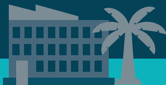
Kunde A (Bill-to) in Kalifornien. Rechnung an Kunde A

Diese Frage wird mir immer wieder gestellt, da sie die Schnittstelle zwischen Vertragsrecht, Umsatzsteuerrecht und Zollverfahren berührt. Die kurze Antwort lautet: Die Adresse des tatsächlichen Warenempfängers muss im ABD Feld 8 erscheinen (Merkblatt zu Zollanmeldungen, Datenelement 13 03 000 000 – Empfänger). Aber ich möchte dennoch einen detaillierteren Blick auf die Antwort werfen, damit Sie die Zusammenhänge besser verstehen.