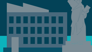
Kunde AB (Ship-to) in New Jersey. Lieferung an Kunde AB